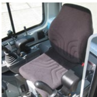
Ergonomisch verstelbare stoel