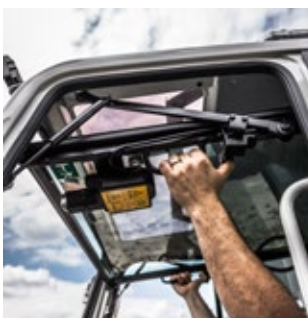
Voortuig te openen d.m.v. gasveer