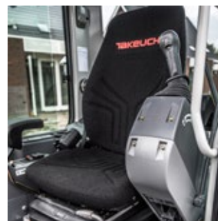
Ergonomisch verstelbare stoel