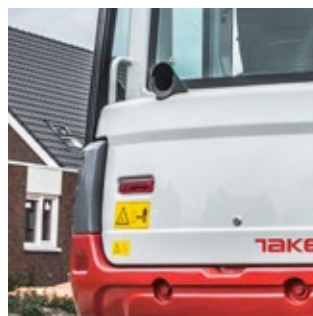
Uitlaat omhoog gepositioneerd