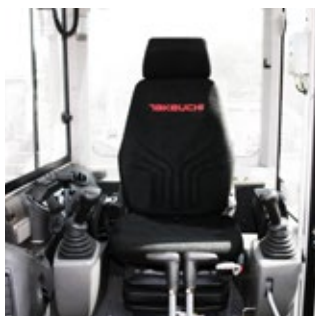
Ergonomische luchtgeveerde stoel