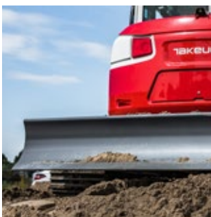
Extra zwaar uitgevoerd dozerblad