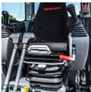
Ergonomische luchtgeveerde stoel